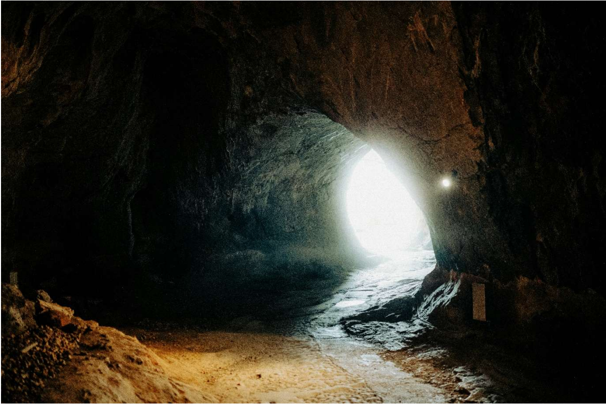
Grotte di Toirano