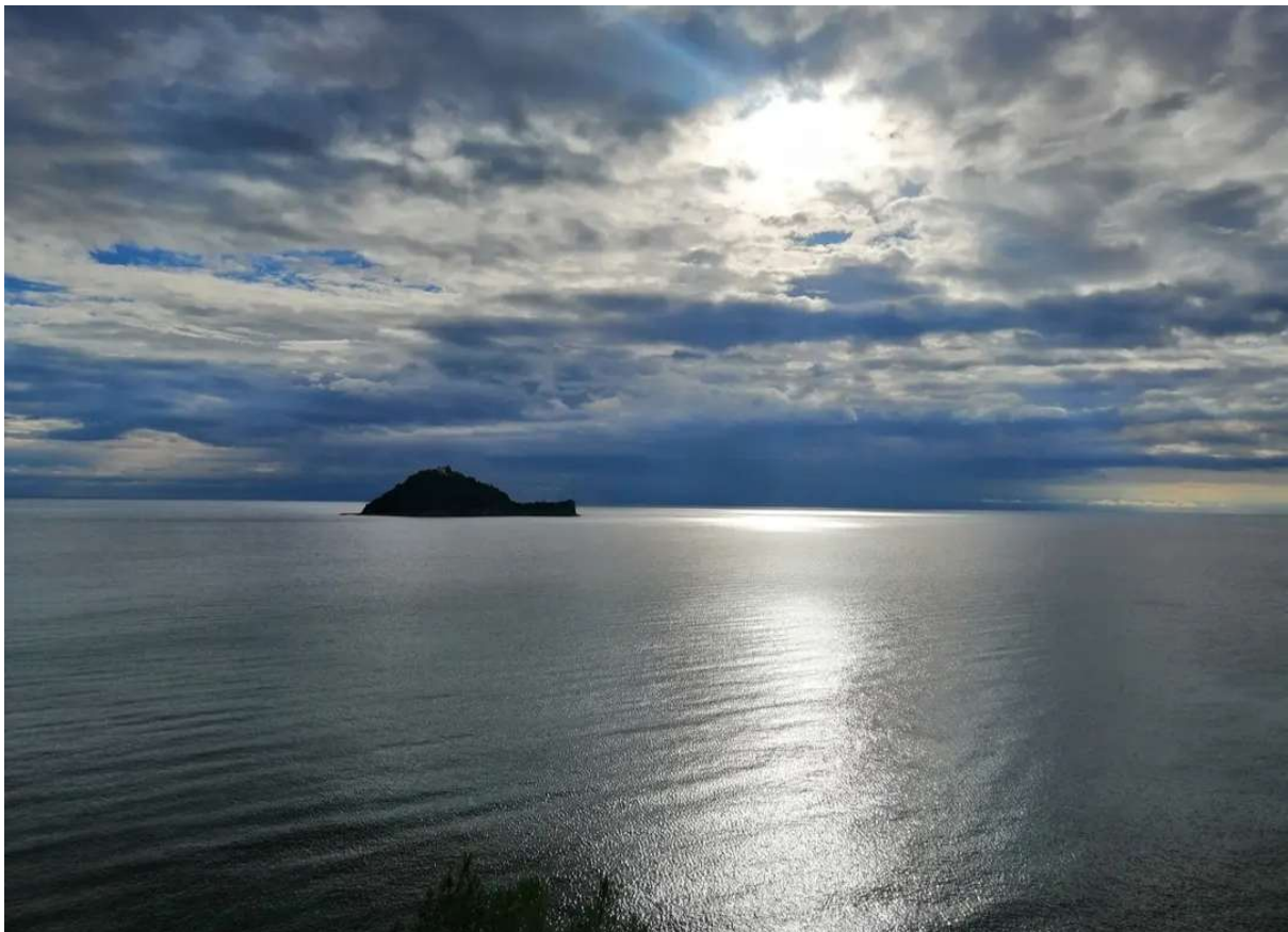
Isola Gallinara